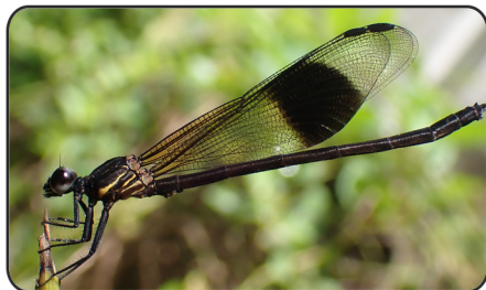
6 方帶溪蟳 Euphaea decorata