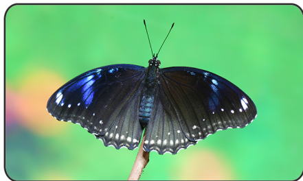
4 幻紫斑蛺蝶 Hypolimnas bolina