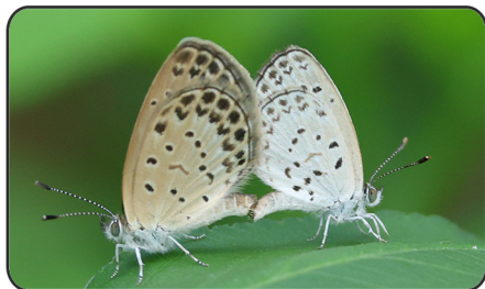
2 酢漿灰蝶 Zizeeria maha