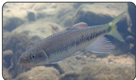
7 異鱗 Parazacco spilurus