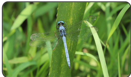
5 呂宋灰蜻 Orthetrum luzonicum