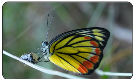
1 優越斑粉蝶 Delias hyparete